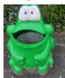
Niet bij plastic of groen? Dan in de kikker= grijze container