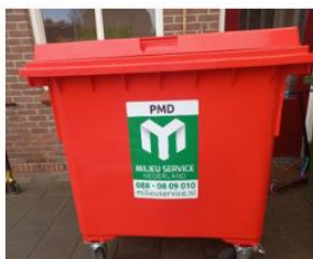
Plastic container Pakjes drinken, plastic verpakkingen