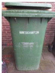
groene container Afval van fruit