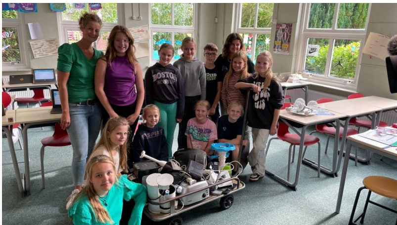
Groep 7/8 bundelt de krachten voor de hoogste eindscore in de E-waste race