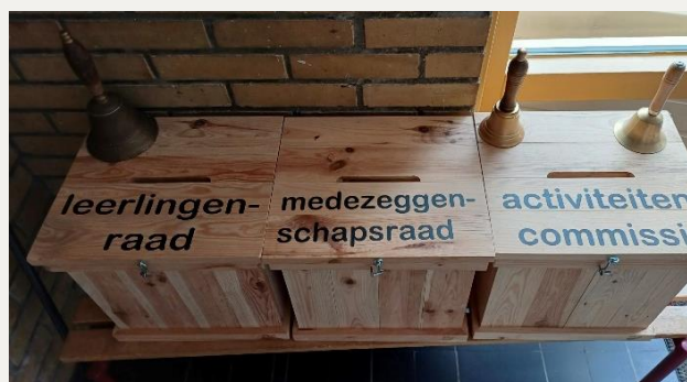
Brievenbussen van de verschillende commissies.

Heeft u suggesties voor één van onze commissies dan kan dat per brievenbus of bij de commissieleden aangegeven worden. De brievenbussen staan bij de hoofdingang.