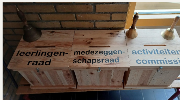
Brievenbussen van de verschillende commissies.

Heeft u suggesties voor één van onze commissies dan kan dat per brievenbus of bij de commissieleden aangegeven worden. De brievenbussen staan bij de hoofdingang.