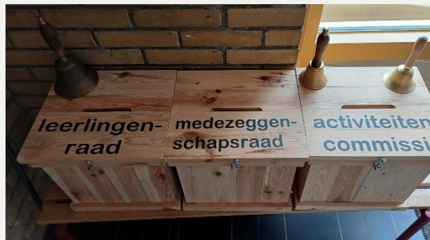
Brievenbussen van de verschillende commissies.

Heeft u suggesties voor één van onze commissies dan kan dat per brievenbus of bij de commissieleden aangegeven worden. De brievenbussen staan bij de hoofdingang.